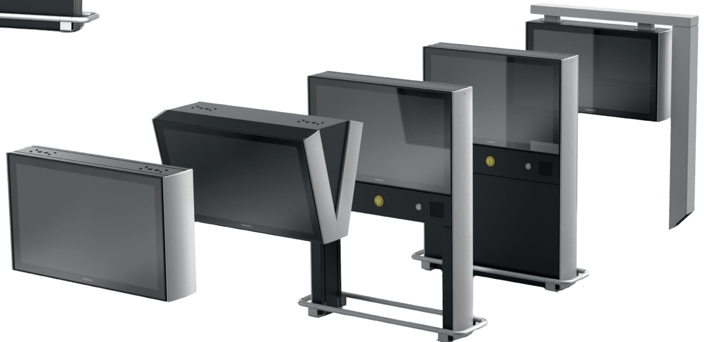
Selection from the Funkwerk Standard Display Portfolio Auszug aus dem Funkwerk Standard Display Portfolio