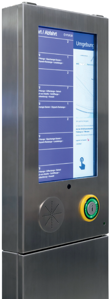
Information column developed in close cooperation with a customer Gemeinsam mit dem Kunden entwickelte Informationsstele

Natürlich unterstützen wir Sie auch bei der Entwicklung eines eigenen, modernen Designs für den besonderen Wiedererkennungswert Ihrer Displays, Stelen oder Sonderprodukte.