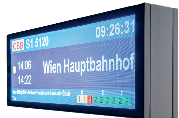
Examples from the Funkwerk hardware range Beispiele aus dem Funkwerk Hardwareportfolio